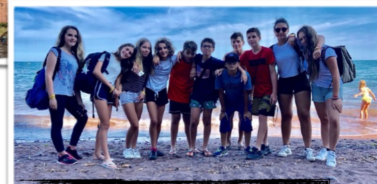
CHILLING OUT ON THE BEACH '18