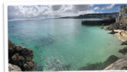
ST. IVES - CORNWALL