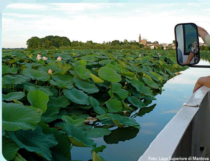
Foto: Lago Superiore di Mantova

Al termine della navigazione, Mantova torna protagonista con il suo centro storico raccolto ed elegante, fatto di piazze rinascimentali, vicoli silenziosi e scorci che conservano intatto il fascino della città dei Gonzaga.